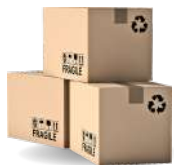
Soluciones de Embalaje