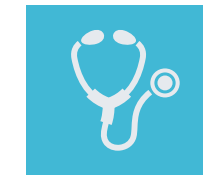
Dispositivos Médicos/ Farmacéutica