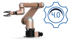
Robótica y automatización