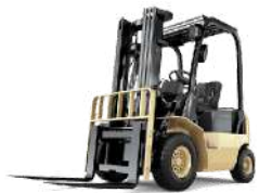
Montacargas y Patines

Si su empresa es proveedora de tecnología para la manipulación y almacenamiento de materiales, Expo SMH será el escenario ideal para desarrollar negocios.