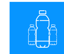
Plástico y Alimenticia