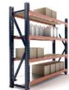
Racks y Sistemas de almacenaje