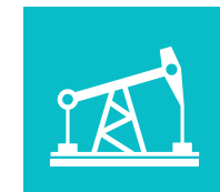
Oil & Gas