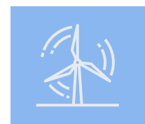
Generación de Energía