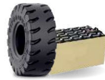
Neumáticos, Baterías y Refacciones