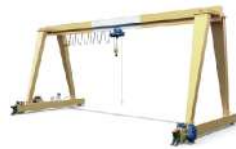
Grúas y polipastos